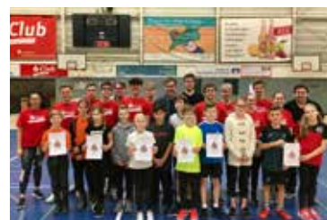
Hühnerballturnier der 5.-Klassen

Im Rahmen der im Schuljahr 21/22 neu zustande gekommenen Kooperation zwischen unserer Schule und dem JC66 Bottrop, bieten wir für unsere Schülerinnen und Schüler, die dem Verein angehören, eine neue Trainingszeit am Dienstagnachmittag von 14:15-15:45 Uhr, in welcher der Schwerpunkt auf dem Krafttraining sowie individuellem Techniktraining liegt. Das Training wird durch einen Trainer des JC66 Bottrop geleitet.