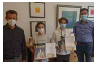
Wettbewerb JuniorING (8)

Die internationale JuniorScience Olympiade (kurz IJSO) ist ein naturwissenschaftlicher Wettbewerb für alle, die Spaß an Chemie, Biologie und Physik haben. Der Wettbewerb besteht aus verschiedenen Runden, in denen spannende Experimente durchgeführt und dokumentiert werden und knifflige Aufgaben gelöst werden. Um sich auf den Wettbewerb besser vorzubereiten und weil Experimentieren mit Freunden mehr Spaß macht, bietet die IJSO-AG einen Raum an, gemeinsam einen Blick in die Welt der Wissenschaftsolympiaden zu werfen.