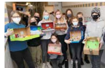
Beleuchtung im Puppenhaus

In Zusammenarbeit mit der Hochschule Ruhr West entsteht auf unserem Schulhof ein autarkes Hybridkraftwerk. Der Bau des Handyladeschranks wird fortgesetzt. Nachdem im vergangenen Jahr die Bewässerung der Grünanlage vorbereitet wurde, soll diese nun umgesetzt werden.