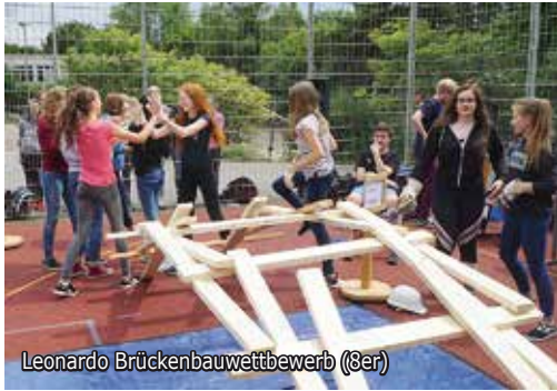
Leonardo Brückenbauwettbewerb (8er)