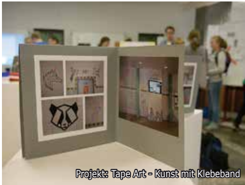
Projekt: Tape Art - Kunst mit Klebeband

Mit dem Abiturzeugnis haben im vergangenen Schuljahr 10 Schülerinnen und Schüler ein MINT-EC-Zertifikat erhalten, das sich bei Bewerbungen sehr gut bewährt hat. Wer seine in der Schullaufbahn belegten Veranstaltungen sammelt und bescheinigen möchte, erhält hierzu ein kleines Heft zum Unkostenbeitrag von 1,- € im Sekretariat. Weitere Informationen finden Sie auf unserer Homepage oder auf www.mint-ec.de/zertifikat . Informationen zum MINT-Bereich erhalten Sie auch über den MINT-E-Mail-Verteiler (E-Mail an waeltring@jag-bottrop.de ).