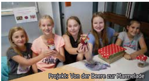
Projekt: Von der Beere zur Marmelade

Feste Wettbewerbsgruppen bereiten sich auf den zdi-Roboter-Wettbewerb im November vor. Im zweiten Halbjahr wird die AG als Einführungsveranstaltung in die Programmierung der Platine Calliope mini und von Lego-Robotern fortgeführt. Mädchen sind in der AG ausdrücklich willkommen.