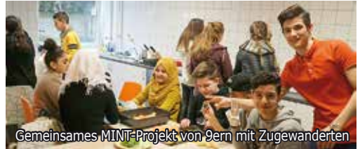
Gemeinsames MINT-Projekt von 9ern mit Zugewanderten

In Zusammenarbeit mit der Hochschule Ruhr West entsteht auf unserem Schulhof ein autarkes Hybridkraftwerk. Nachdem die Solarpaneele die Batterien aufladen können, folgt die Installation des Windrads und die Fertigung von Handy-Ladefächern. Neulinge sind in der Gruppe herzlich willkommen: Es gilt, den 1. Platz beim gleichnamigen zdi-Wettbewerb zu verteidigen.